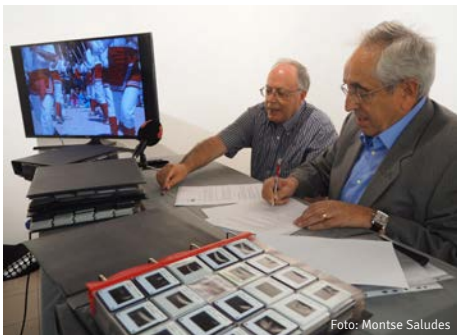
Acte de donació del fons de d'Antoni Comellas i Garcia

No podem deixar d'encoratjar la ciutadania en seguir confiant en l'arxiu, dipositant aquelles imatges de Terrassa, de qualsevol època i suport que contribuïran al compliment dels objectius fundacionals.