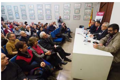
Presentació de l'anuari 2015.

El fotoperiodista Ricard Domènech i Olivares, és l'autor de la redacció del llibre. Pep Vallory i Catà, col·laborador informàtic de l'arxiu, s'ha ocupat de la confecció dels índexs, i Montse Saludes i Closa és l'autora de la majoria d'imatges, alhora que també ha coordinat la publicació.