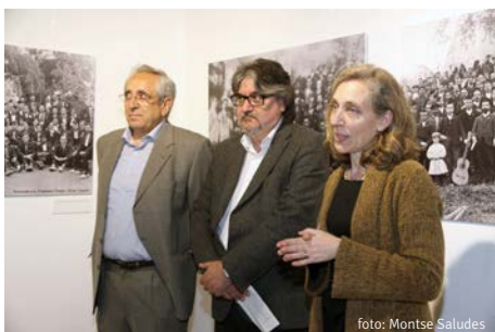
Inauguració de l'exposició "El Cant dels obrers"