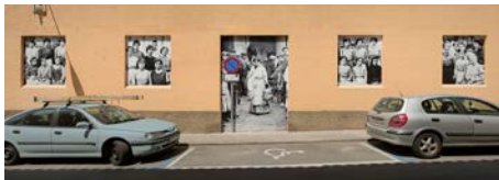
Murs exteriors del mNACTEC