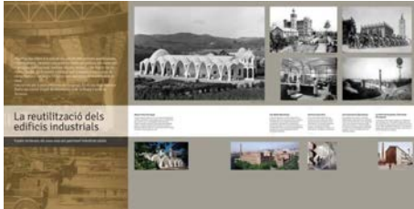
Plafó de l'exposició Espais Recobrats al mNACTEC