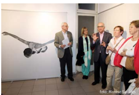
Inauguració de l'exposició "Identitat Esculpida"