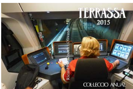
Portada de l'anuari 2015.