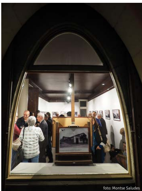
Inauguració de l'exposició "El Sindicat Agrícola de Terrassa"